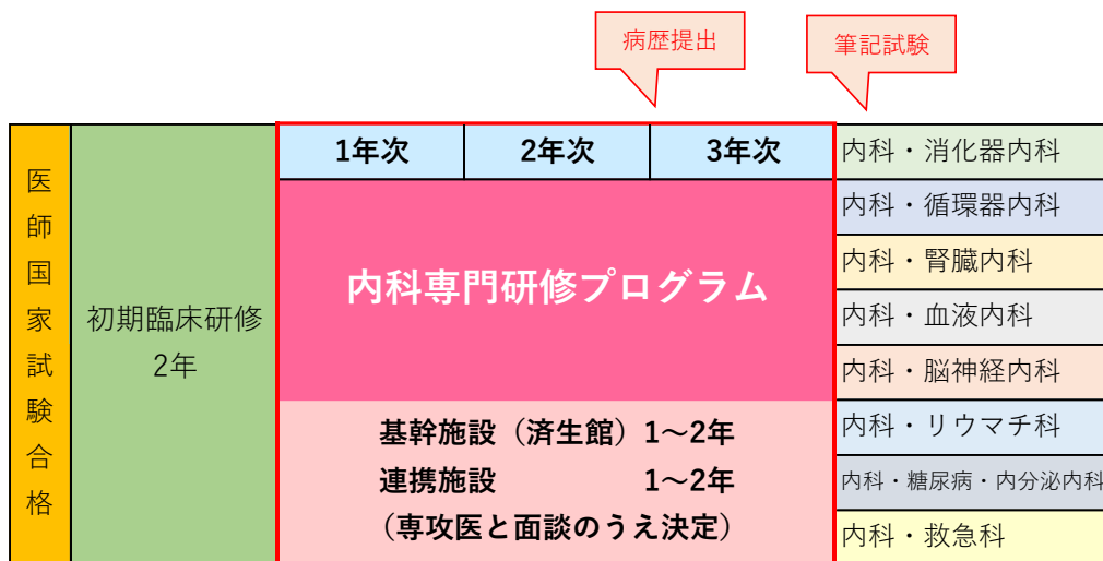
図1.山形市立病院済生館内科専門研修プログラム概念図

基幹施設である山形市立病院済生館内科で、専門研修（専攻医）1～2年間の専門研修を行います。